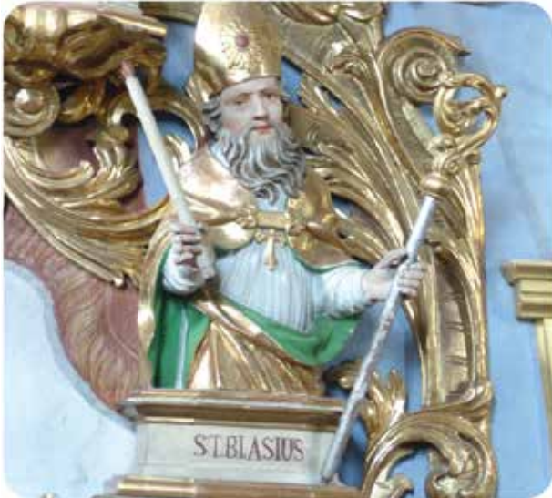
Pfarrkirche Niederolang, Foto: Peter Kane

Spielerliste und erster Probenplan werden ab Ende Jänner auf www.passion.at (Rubrik: Service/Spielerinformation) ersichtlich sein!